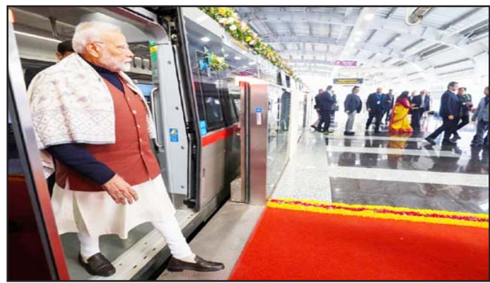
हैदराबाद, (एजेंसी)। पीएम नरेंद्र मोदी सोमवार को हैदराबाद में चरलापल्ली रेलवे टर्मिनल का उद्घाटन करेंगे। चरलापल्ली रेलवे स्टेशन पर आयोजित होने वाले